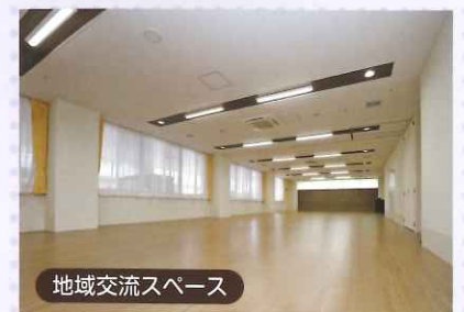
地域交流スペース